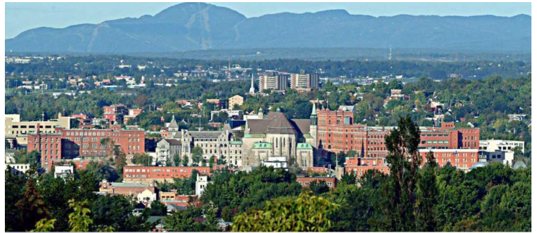
Vue de la ville de Sherbrooke.

« Pour le plaisir de se rencontrer et de se raconter »