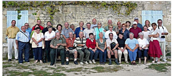
Photo prise à l'occasion d'une cousinade des Bilodeau du Québec en France du 25 août au 5 septembre 2007, au Poitou pays de l'ancêtre Jacques Billaudeau.

Les Associations Bilodeau d'Amérique et Billaudeau de la France s'unissent pour dire « Bonne Fête Québec, 1608-2008 »